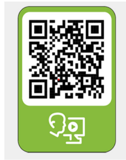
Anleitung Schneider EVlink Pro AC

So wird die Bereitstellung von Ladeinfrastruktur einfach, übersichtlich und finanziell attraktiv. Anders als viele Einzellösungen, die sich nur auf Monitoring oder Abrechnung konzentrieren, bietet unsere Plattform alle Funktionen in einem Gesamtpaket . Das spart Zeit und optimiert die Verwaltung der Infrastruktur.